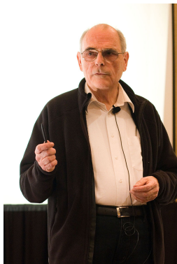
Figure: Volker Strassen (born in 1936, German mathematician)