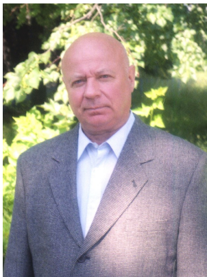
Figure: Anatoly Alexeyevich Karatsuba (1937-2008, Russian mathematician)